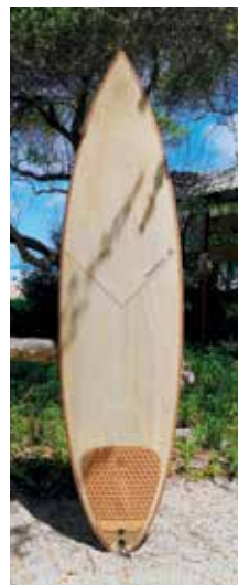
Wood'nShape gamme de surfs Gun – Hobbit – shortboard performance 6'3"-19"3/4-2"1/3 en peuplier et balsa. Fibre de lin sur le dessous et fibre de verre sur le dessus.