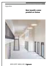
Lignatec 32 Bois lamellé croisé produit en Suisse