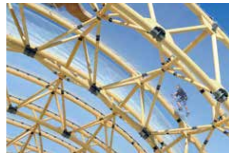
Centre « Vitam'Parc », Neydens (France), 2009. Portée maximale des arcs triangulés à 2 articulations de 43 m

Dépasser les limites usuelles de portée pour permettre la réalisation de projets d'ampleur est tout à fait possible avec le bois. En poutre simple, en systèmes triangulés ou en caissons, les performances statiques peuvent aussi être augmentées avec le recours à des systèmes spatiaux de type coques ou membranes. Des portées libres de plus de 40 mètres ne constituent alors pas une prouesse technique.