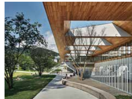
Centre sportif Heuried, Zurich, 2017 (EM2N Architekten AG, Zurich)

Tout comme l'impressionnant porte-à-faux de la patinoire de Heuried, la construction bois dépasse régulièrement les limites conventionnelles du point de vue statique. En particulier, les systèmes constructifs à base d'éléments en lamellé-collé ou en panneaux lamellé croisé, offrent toujours plus de libertés pour les ingénieurs afin de développer des solutions structurelles adaptées à toutes les situations.