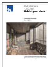
Bulletin bois 138/2021 Habitat pour aînés

Auteur: Josef Kolb Broché, 320 pages, 2011