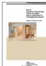
Bois et panneaux à base de bois Usage du commerce en Suisse

Lignum, économie suisse du bois , est l'organisation faitière de l'économie suisse de la forêt et du bois et réunit toutes les associations et organisations importantes de la filière, les instituts de recherche et de formation, les corporations publiques ainsi qu'un grand nombre d'architectes et d'ingénieurs.