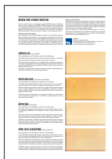
Bois de chez nous