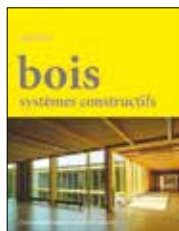
Bois Systèmes constructifs

Auteur: Josef Kolb Broché, 320 pages, 2011