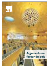
Arguments en faveur du bois