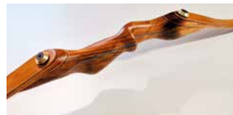
Arc Longbow Le Shaman avec poignée en bois lamellé collé et détail d'un arc démontable SMB courbe en Shedua et liseré peuplier.