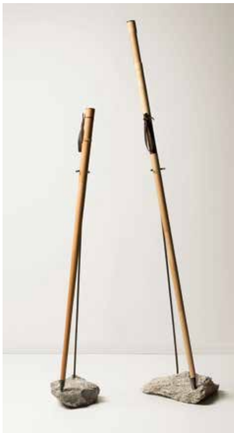
Bâtons de marche démontables

De même, le facteur d'arc Sébastien Meylan conçoit des arcs bois sur mesure pour le tir instinctif dans la tradition des arcs Merlin Archery Switzerland.