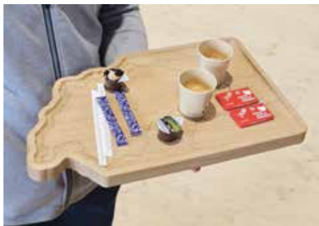
Chocolats suisses aux couleurs des JBS25 (Daniel Ingold)

Comment le bois de nos forêts devient-il une maison, une table ou un cor des Alpes? Peut-on vraiment construire des immeubles en bois indigène?