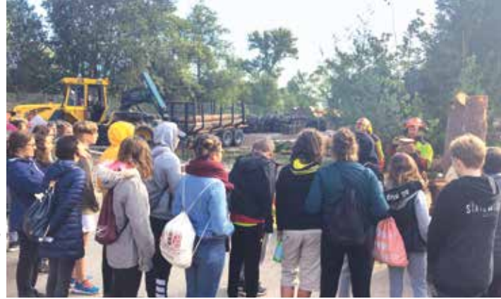
Marketing Bois Suisse