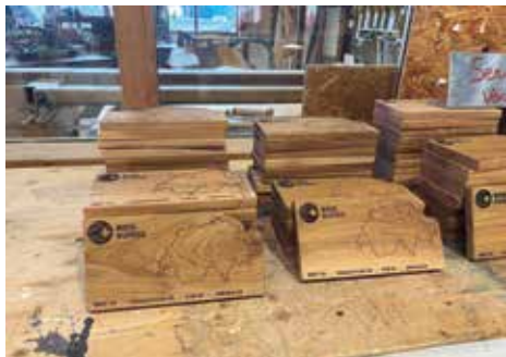
Souvenirs pour les visiteurs réalisés par le groupement du Nord vaudois (Sébastien Droz)

Les Communautés d'action régionales de Lignum romandes CAR ainsi que la Plateforme vaudoise du bois ont été des partenaires importants dans la mise sur pied locale de cet événement. Le Cedotec Office romand de Lignum a quant à lui coordonné les regroupements romands ainsi que la communication sur le plan supra régional. Il a également apporté son soutien aux regroupements pour l'élaboration de leurs visuels de communication.