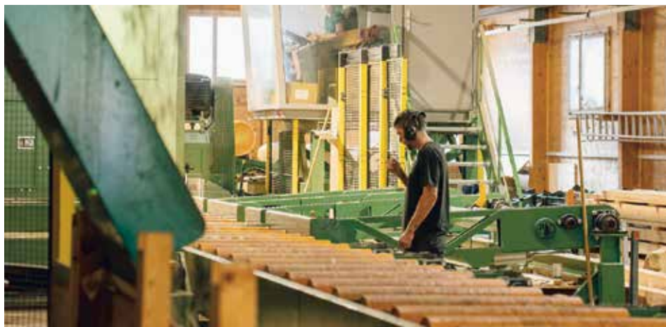
auprès de mon arbre

Les écoles ont quant à elles bénéficié d'un parcours interactif les conduisant à travers la forêt, à la découverte des métiers de forestier-ères et de bûcheron-nes, jusqu'aux ateliers de charpenterie, de menuiserie et d'ébénisterie.