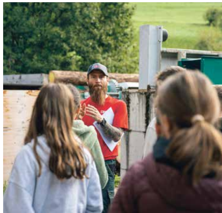
auprès de mon arbre