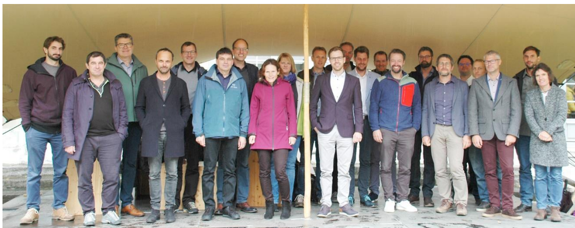
Groupe de création de la STE-AoC le 29 septembre 2022 à Berne.

Télécharger l'image en qualité impression (2360 x 1694 px, 3.16 MB)