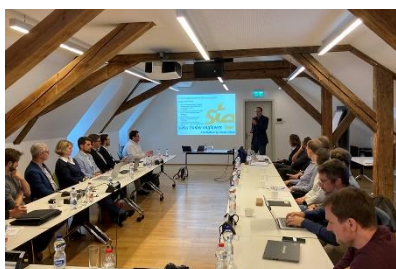
Assemblée constitutive de Swiss Timber Engineers Association of Construction (STE-AoC) le 29 septembre 2022 à Berne.

Télécharger l'image en qualité impression (3568 x 3408 px, 2.79 MB)