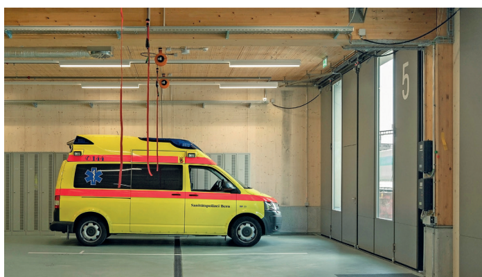
Illustration: Dominique Wehri

Le nouveau bâtiment qui abrite les services de secours et la centrale des appels sanitaires urgents du canton de Berne a été érigé en bois conformément aux exigences du standard Minergie-ECO. L'ouvrage a été construit entièrement en bois, à l'exception de la surface de circulation et des plafonds, qui allient le bois et d'autres matériaux. Pour la construction de ce bâtiment, on a opté judicieusement pour une séparation des systèmes, qui permet en effet un renouvellement des différents éléments de construction sur la base de leur cycle de vie, une utilisation flexible du bâtiment, ainsi qu'une élimination facile des matériaux. La statique de cet ouvrage en bois permet par ailleurs sa surélévation jusqu'à trois niveaux. ( lien )