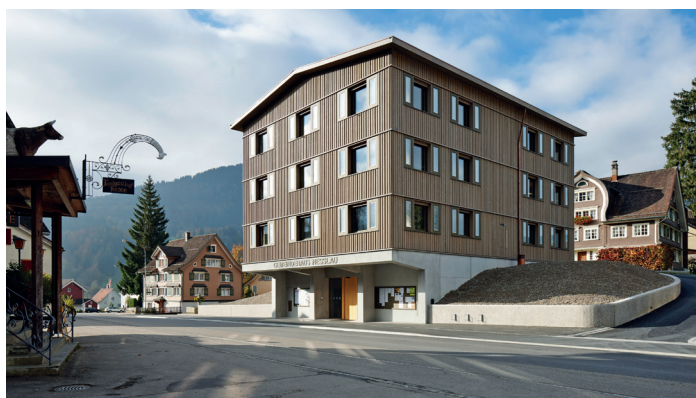
Illustration: Ralph Feiner

Bois indigène: Suite à une décision du conseil municipal, le nouveau bâtiment communal de Nesslau devait être construit au moyen de bois indigène, issu de la forêt avoisinante. Le projet a été mis au concours, et c'est une offre de construction mixte qui a passé la rampe. En sa qualité de maître d'ouvrage, la commune avait demandé aux entrepreneurs d'exposer, lors de la remise de l'offre, la chaîne de production des éléments en bois, dès leur point de départ dans la forêt jusqu'à leur incorporation dans le nouveau bâtiment communal. ( lien )