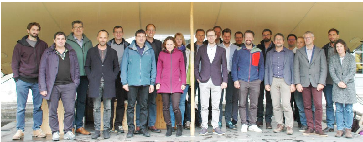
Gründungsgruppe der STE-AoC am 29. September 2022 in Bern.

Download Druckdatei (2831 x 1109 px, 2.05 MB)