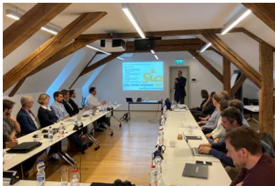
Gründungsversammlung der Swiss Timber Engineers Association of Construction (STE-AoC) am 29. September 2022 in Bern.

Download Druckdatei (3568 x 3408 px, 2.79 MB)